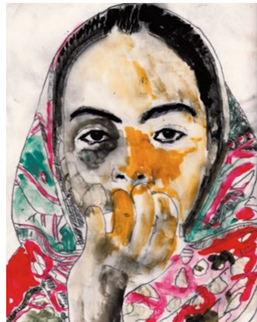
Abb.: „Tigray Girl“ Thomas Berghaus

einer lockeren Runde informieren. Eine erste Veranstaltung fand im Dezember 2016 mit großem Erfolg in unserer Galerie statt. Die Sammlung umfasst zur Zeit rund 100 Bilder von 15 Künstlern und wächst stetig. Ein Werkverzeichnis der Sammlung finden Sie unter www.art-of-buna.de . Denkbar sind Gruppenausstellungen in den verschiedensten Konstellationen zu unterschiedlichen Themen. Etwa zeitgenössische Malerei, Holzschnitte und Radierungen, Fotografie, afrikanische Kunst etc. Gerne ergänzen wir unsere Ausstellungen um ein Rahmenprogramm mit Informationen zur Hilfsorganisation Cap Anamur. Wir stellen Informationsmaterial zur Verfügung oder organisieren einen Vortrag über die Arbeit des Vereins.