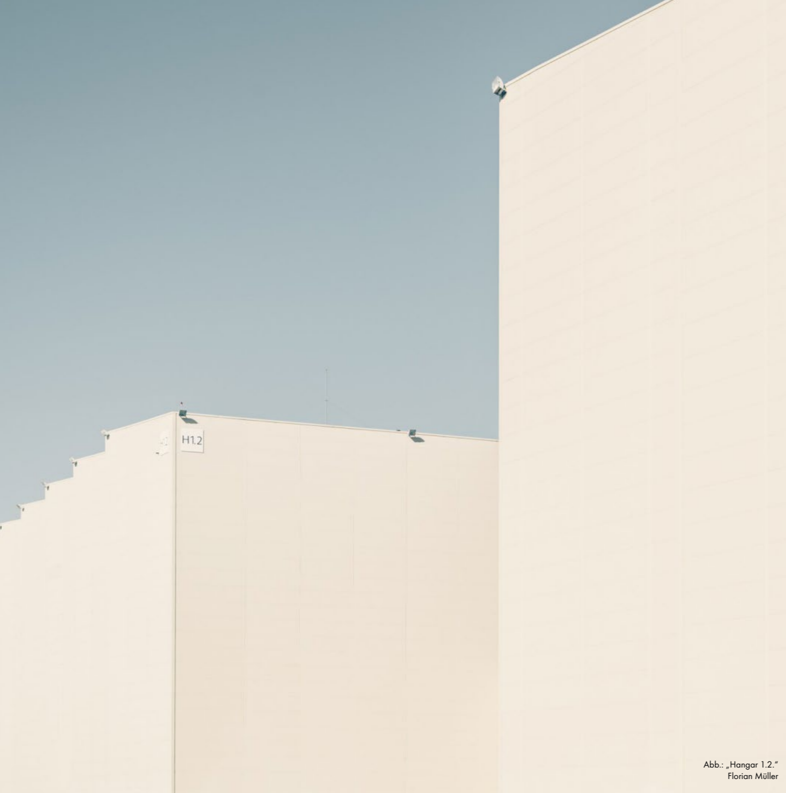
Abb.: „Hangar 1.2.“ Florian Müller