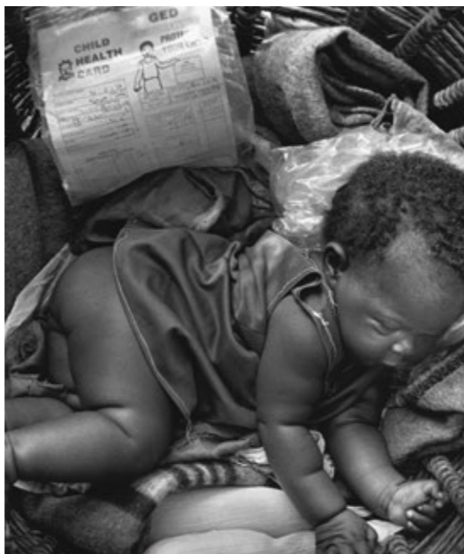
Abb.: „Kind im Korb, Südsudan“ Jürgen Escher