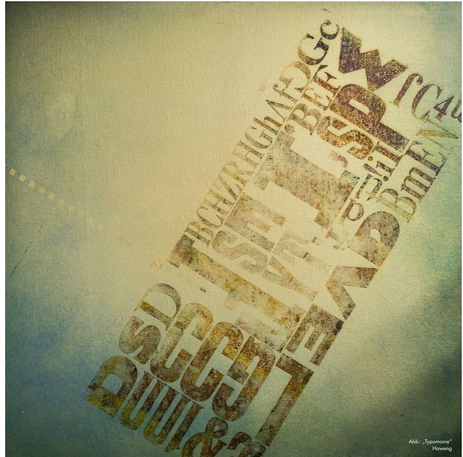
Abb.: „Typomanie“ Haweng