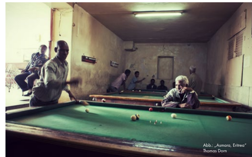
Abb.: „Asmara, Eritrea“ Thomas Dorn